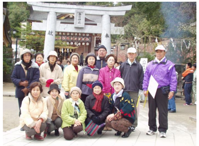
春日神社での記念写真

1月5日朝8時、公民館前でストレッチ体操の後、総勢16名、一路春日神社に向かってスタート。春日神社では参拝の後、おみくじを引いて今年の運勢を確認し記念写真の後今度は、平野神社に向かい公民館に戻ってきました。途中は話題が広がりなごやかに歩いた為、寒さも疲れもまったく感じない楽しい2時間でした。