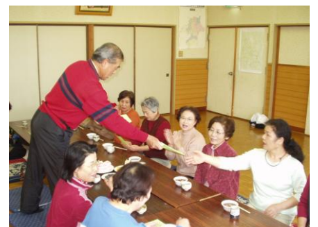
完歩証をもらい、ぜんざいを食べて温まりました